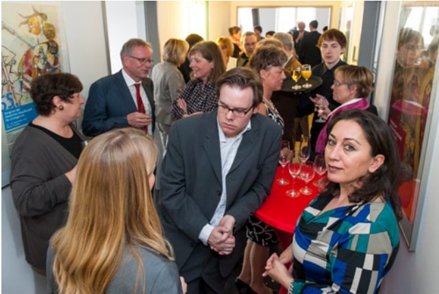
Bei der offiziellen Einweihungsfeier in den Räumen des Hauptstadtbüros, nutzten Gäste und Gastgeber die Gelegenheit zum Austausch.

Am 17. April 2013 wurde es offiziell eingeweiht: das neue gemeinsame Hauptstadtbüro von DGU und BDU in Berlin Charlottenburg. Die Vorstandsvertreter beider Verbände konnten hochrangige Gäste aus dem Gesundheitswesen und Repräsentanten der Hauptstadtpresse sowie der urologischen Fachpresse